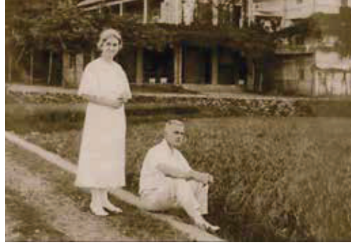
圖五 Dr. G. Gushue-Taylor (戴仁壽醫師)；夫婦在樂山園。