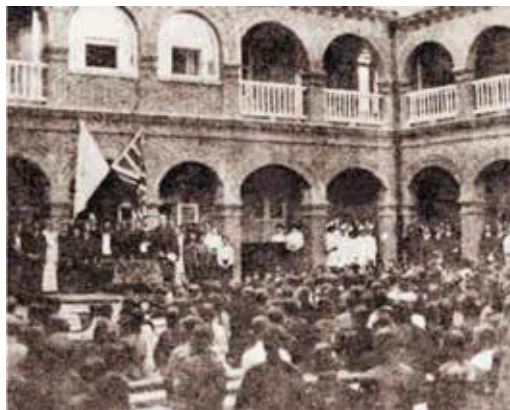
圖四 第一代馬偕紀念醫院的開幕典禮。